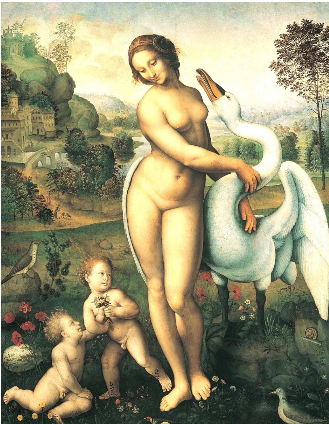
და ვინჩის გრაფიკული ჩანახატის მხიედვით აღდგენილი “ლუდა და გელი”