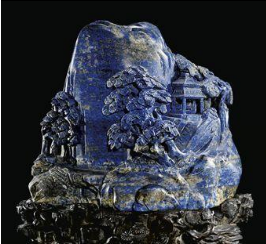
ლაზურიტის გრავეურა, რომელიც მოხსენიებულია ლექსში Lapis La